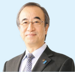
新潟県知事 花角英世

県としても、企業の実践的・継続的な取組を一層後押しすることにより、誰もが働きやすく、能力を発揮できる職場づくりを推進してまいります。