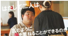
安田瓦職人が主人公のラブコメディを映画の予告風に